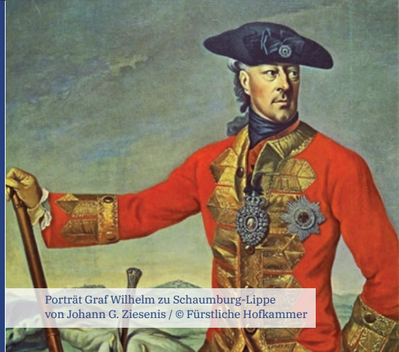
Porträt Graf Wilhelm zu Schaumburg-Lippe von Johann G. Ziesenis

Als Militärschule, Wissenschafts- und Forschungszentrum, auch als Sternwarte wurde der Wilhelmstein genutzt. Er zog viele berühmte Besucher an – und war sogar Vorbild für die portugiesische Festung Fort de Lippe bei Elvas. Das erste Unterwasserboot der Welt, der „Steinhuder Hecht“, wurde hier als Prototyp entwickelt. Bis 1876 war die Insel Staatsgefängnis Schaumburg-Lippes und die erste deutsche Gefängnisinsel.